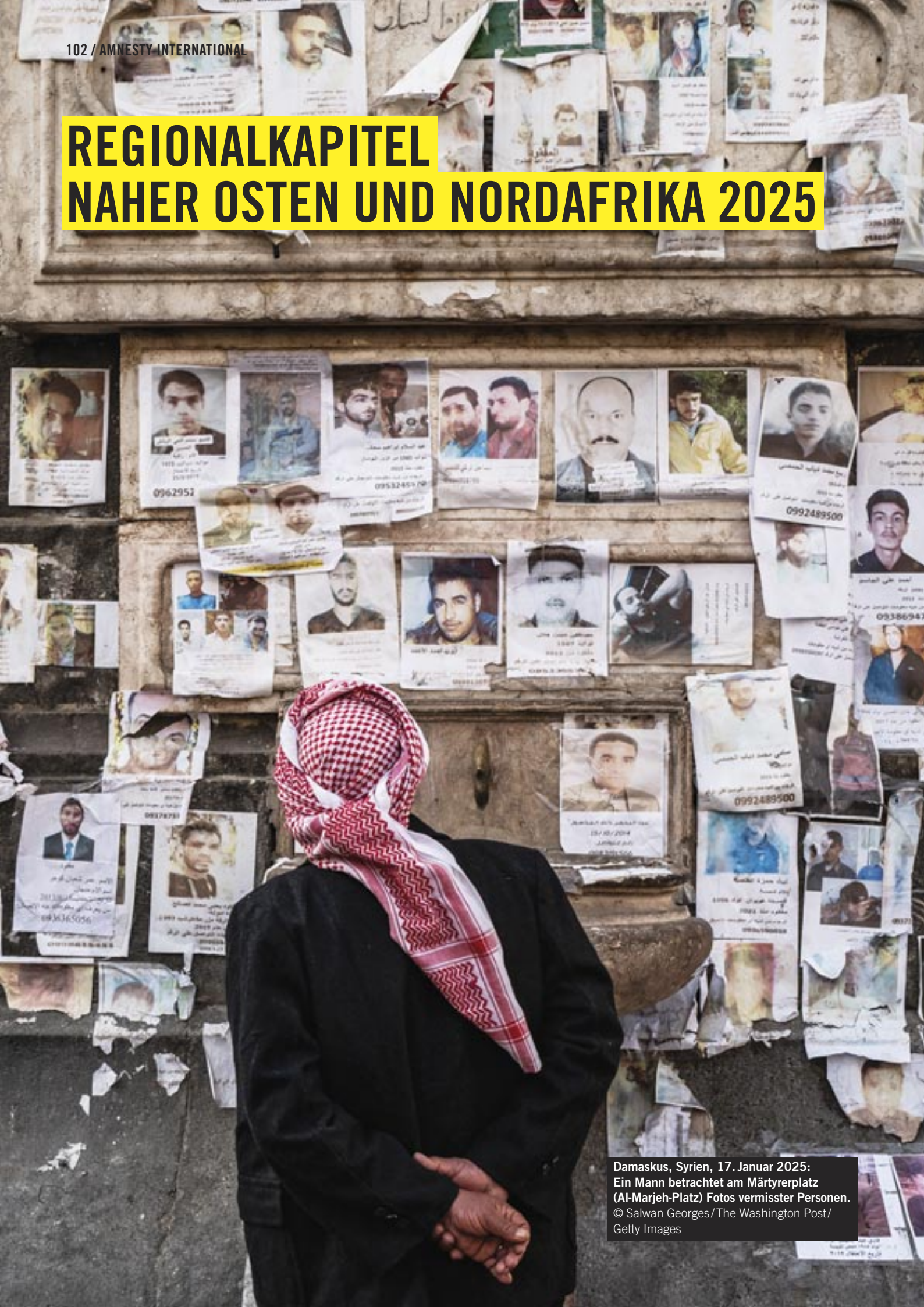
Damaskus, Syrien, 17. Januar 2025: Ein Mann betrachtet am Märtyrerplatz (Al-Marjeh-Platz) Fotos vermisster Personen.