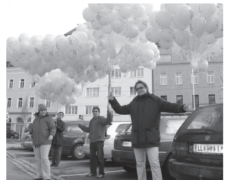
Vor dem Marsch durch Linz anlässlich 60 Jahre Allgemeine Erklärung der Menschenrechte

Unsere Gruppe war und ist auch stets bemüht, über den eigenen Tellerrand hinauszublicken: Viele unserer Mitglieder besuchen menschenrechtsbezogene Fortbildungsveranstaltungen und nehmen an regionalen und nationalen Treffen teil oder organisieren diese. Einige Gruppenmitglieder hatten und haben auch auf österreichweiter, ja sogar internationaler Ebene Funktionen inne.