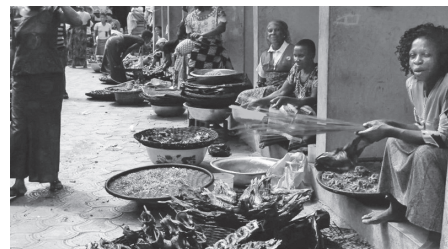
Menschen verkaufen Fisch in Bodo, Mai 2011. Der Fischpreis explodierte nach dem Ölleck von 2008.

wie vor wird Öl durch Shell-Pipelines aus anderen Teilen dieser Region durch das Ogoniland transportiert.