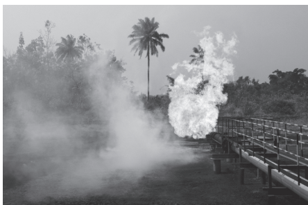
Gas-Abfackelung in Ughelli West, Delta State, Nigeria, 26. 1. 2008

Nigeria, im Westen Afrikas mit der Hauptstadt Abuja, ist mit ca. 924.000 km 2 eines der größten Länder dieses Kontinents. In 32 Bundesstaaten mit ca. 150 Mio. Menschen gibt es ungefähr 400 verschiedene Ethnien und Sprachen. Die Volksgruppen Hausa, Yoruba und Ibo machen etwa 60 % der Bevölkerung aus, 50 % sind Muslime, 45 % Christen und 5 % andere Glaubensrichtungen. Seit 1960 ist Nigeria ein unabhängiger Staat, seit 1999 Präsidentschaftsrepublik und Sitz der ECOWAS ( The Economic Community Of West African States ).