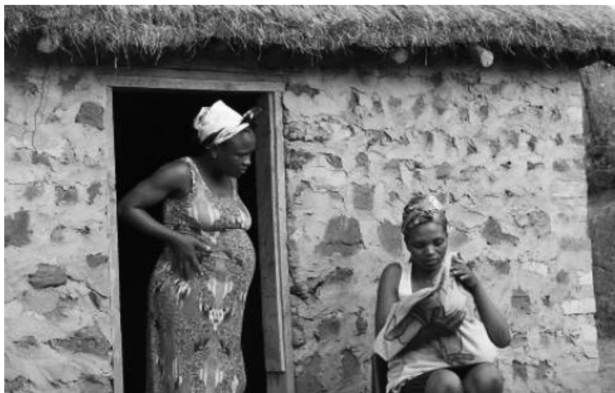
Zwei Schwestern im Bezirk Uthungulu, KwaZulu-Natal, vor ihrer Hütte

PROBLEM: ENTFERNUNGEN ÜBERWINDEN. Auch der Zugang zu Gesundheitseinrichtungen kann ein großes Problem sein. Für ein großes Gebiet gibt es nur ein einziges Gesundheitszentrum in Amsterdam. Manche Menschen müs-