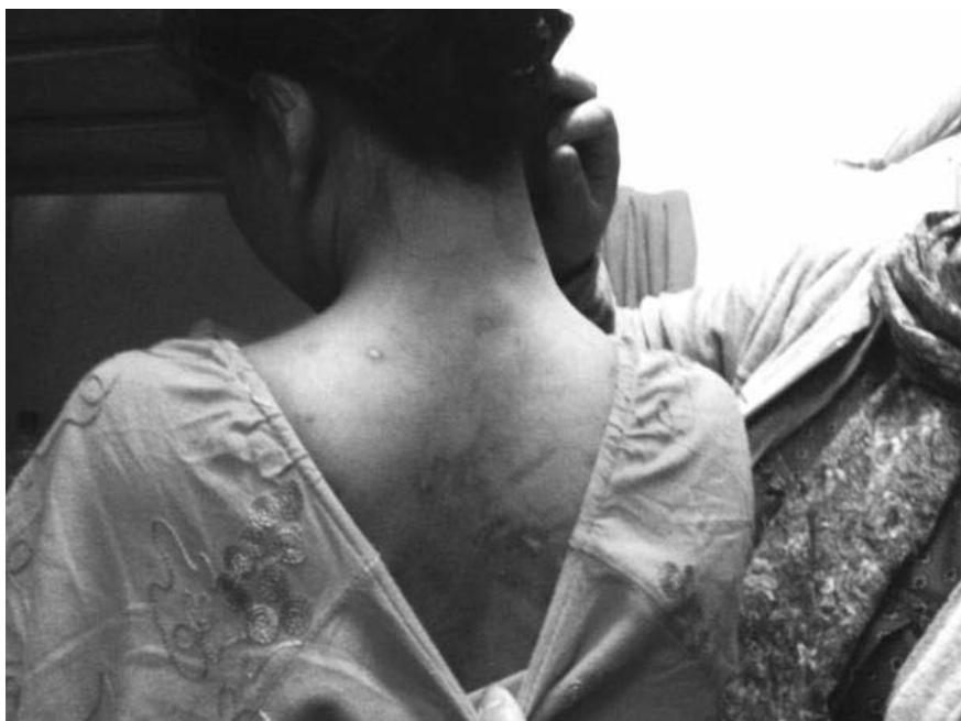
Eine indonesische Hausangestellte in Katar zeigt die Narben der Misshandlungen durch ihre Arbeitgeberin.

Amnesty International hat im vergangenen Jahr in zwei umfangreichen Berichten die ausbeuterischen Praktiken in Katar dokumentiert, auf Großbaustellen und im Haushaltssektor. Berichtet wurde über ausständige Lohnzahlungen, harte und gefährliche Arbeitsbedingungen, heruntergekommene Unterkünfte und schockie-